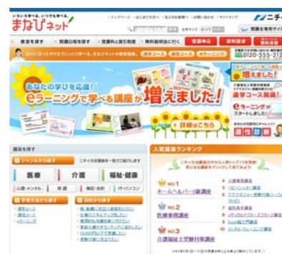
「まなびネット」トップページ