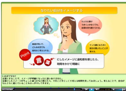
[メンタル・トレーニング講座]