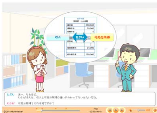
[アニメで学ぶFP入門講座]