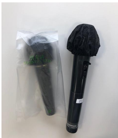
マイクカバーの装着