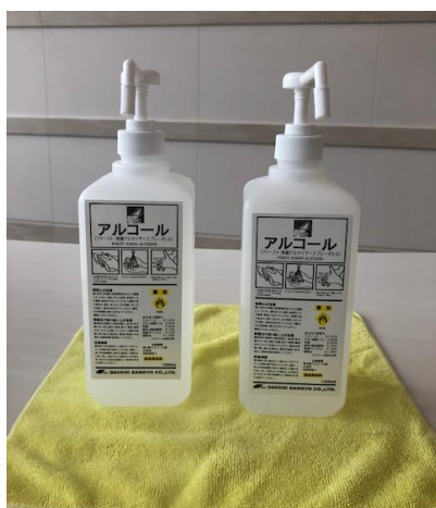
アルコール消毒液