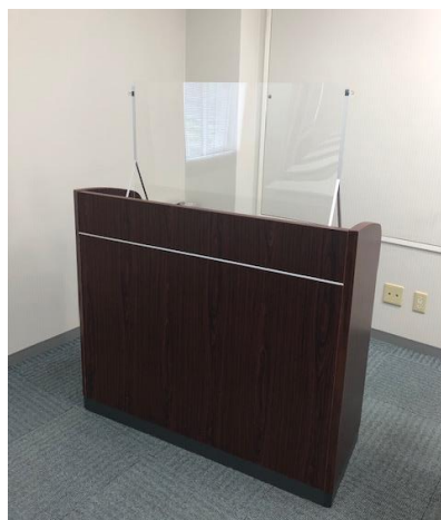
アクリルパーティション