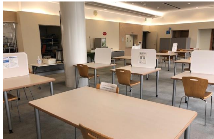
レストランフロア

お客様に安心してご利用いただけるよう、感染防止に取り組んで参ります。 何卒ご理解・ご協力の程よろしくお願ひいたします。