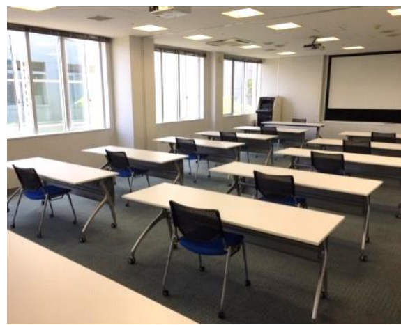
コロナ対策レイアウト (例)