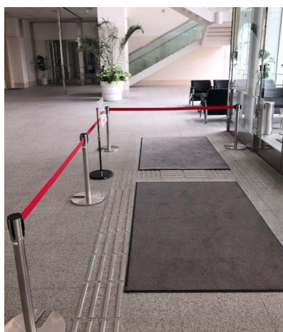
ベルトパーティション