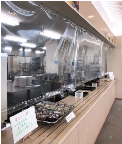
ビニールカーテン