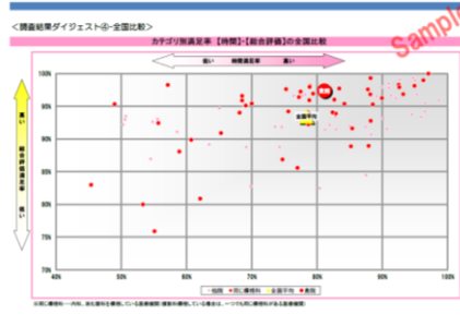
分布図で全国平均との比較を見える化