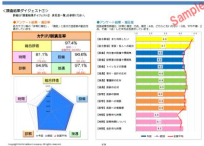
ひと目でわかるダイジェスト

調査内容をカテゴリ分けし、一目でわかるようにしています。 また自院の患者評価と全国各地の医療機関の評価との比較が可能です。