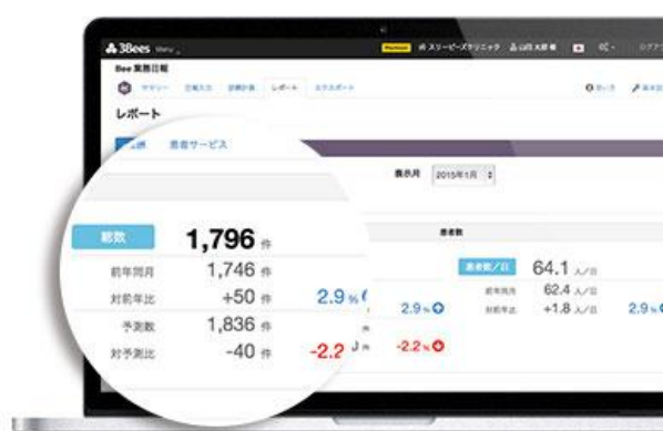
【詳細レポート 画面イメージ】

「3Bees（スリービーズ）」サイト： http://www.3bees.com