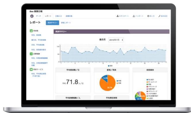
【月次レポート 画面イメージ】