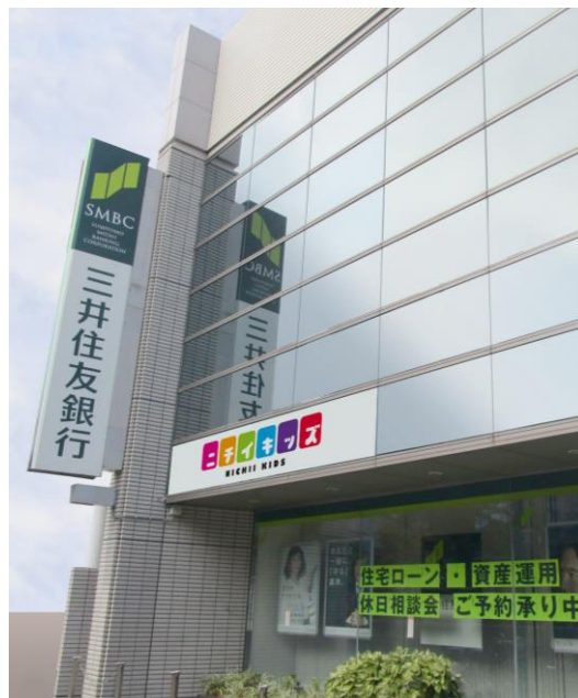
三井住友銀行雪ヶ谷支店