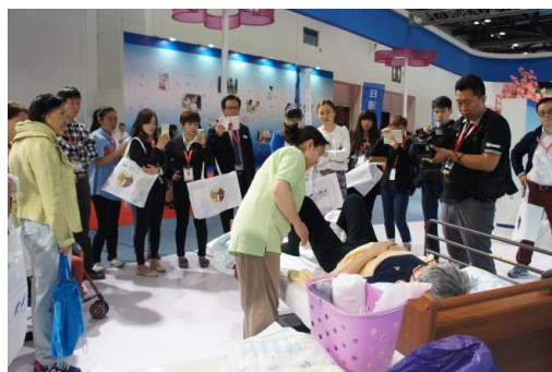
【昨年の博覧会の様子】

ニチイのブースにも、中国政府や高齢者事業の関係者など、毎年多くの方にご来場いただいております。